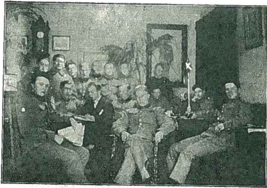
Interiør fra det nuværende Soldaterhjem.