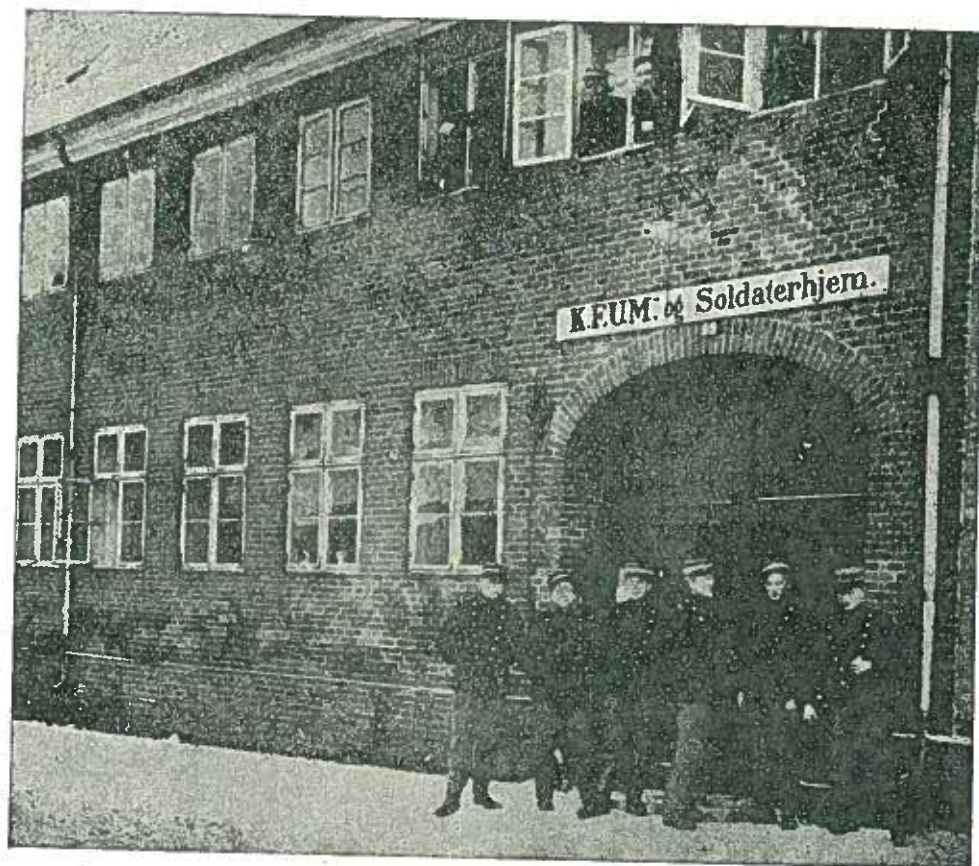
Det gamle Hjem i Sct. Olsgade.

Ved de daglige Aftenandagter forkyndes der baade gennem Sang, Tale og Bøn, og ved de ugentlige Bibel-